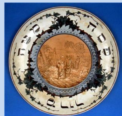
צלחת סדר, צרפת *