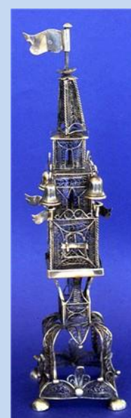
מגדל בשמים, פולין*