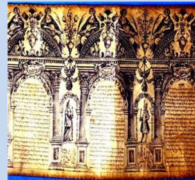
מגילת אסתר, איטליה*