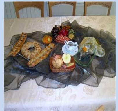
ה"סימנים" בסדר ראש השנה